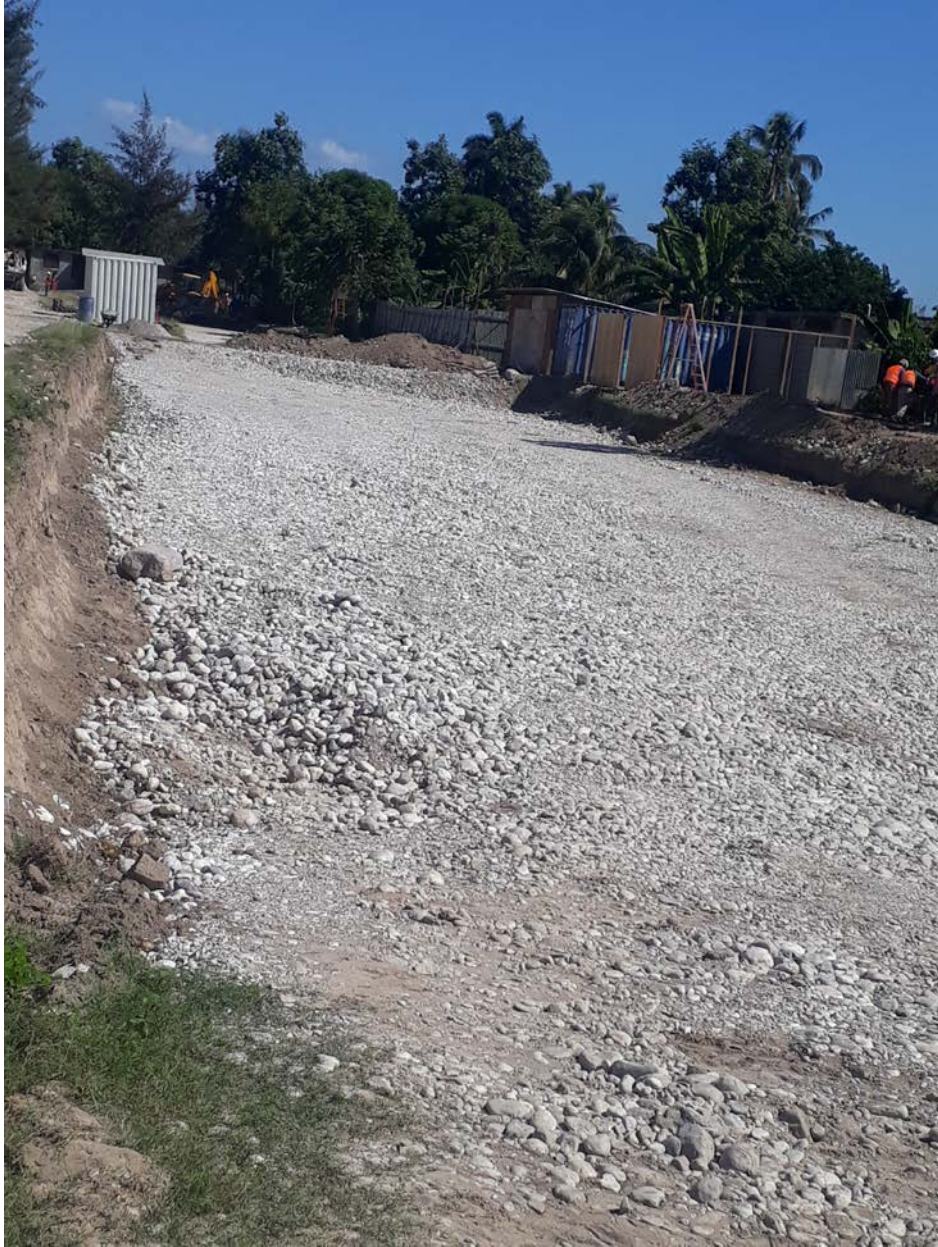
Deuxième couche de remblais dans les salles de classes en attente de test de compactage par le LNBTP