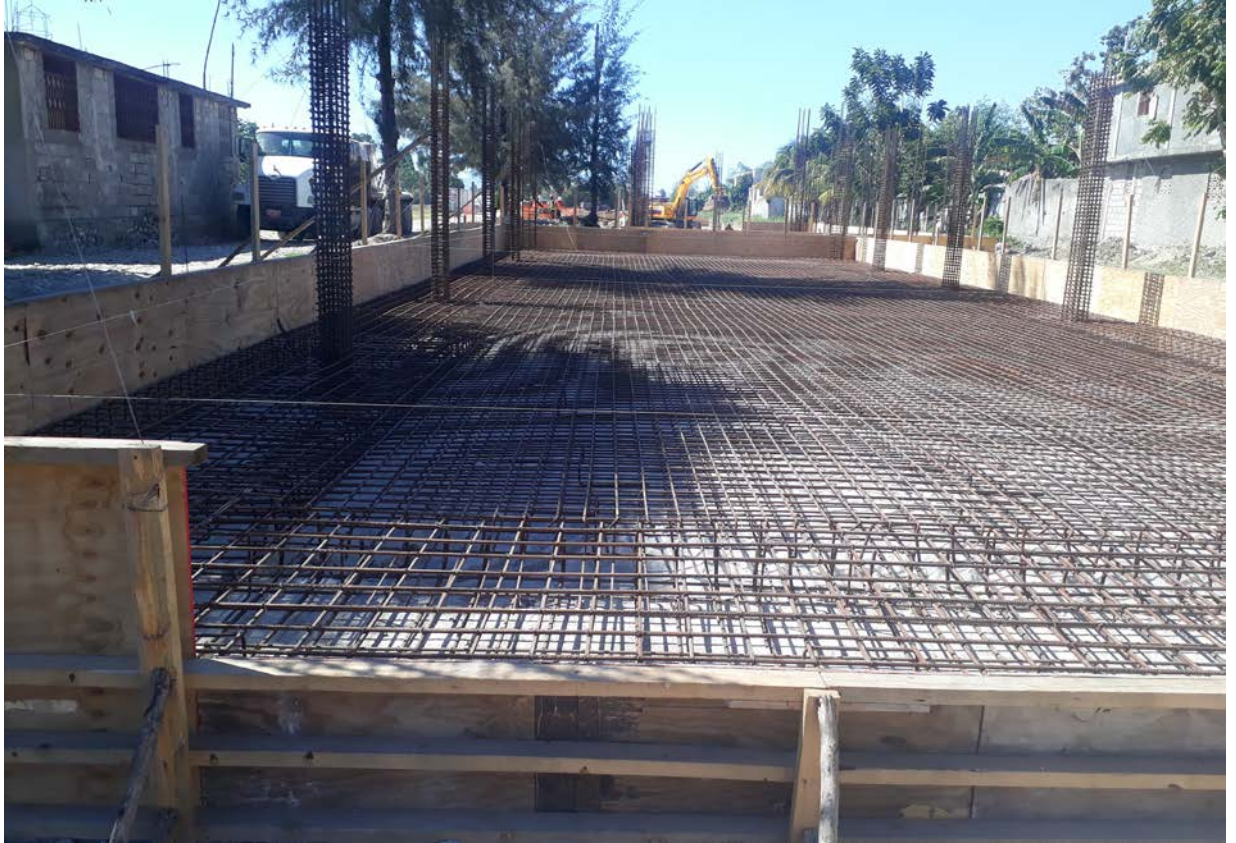
Ferrailage terminé en attente du coulage de béton