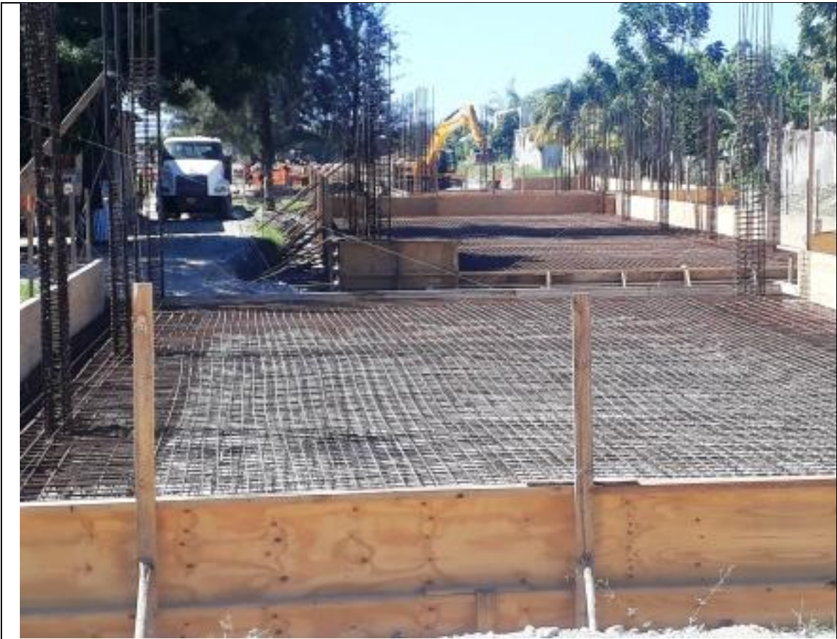
Ferrailage terminé en attente du coulage de béton