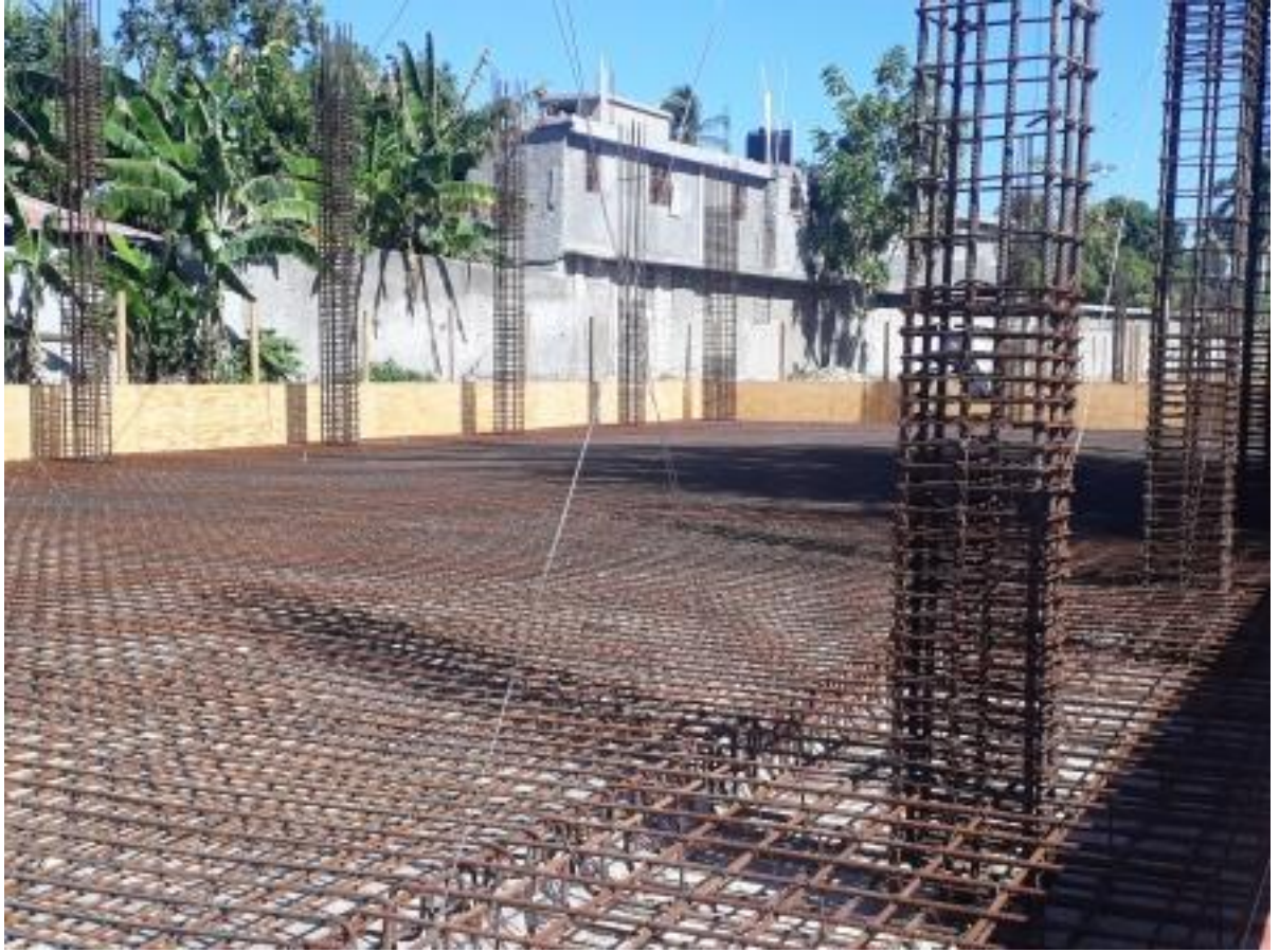
Ferrailage terminé en attente du coulage de béton