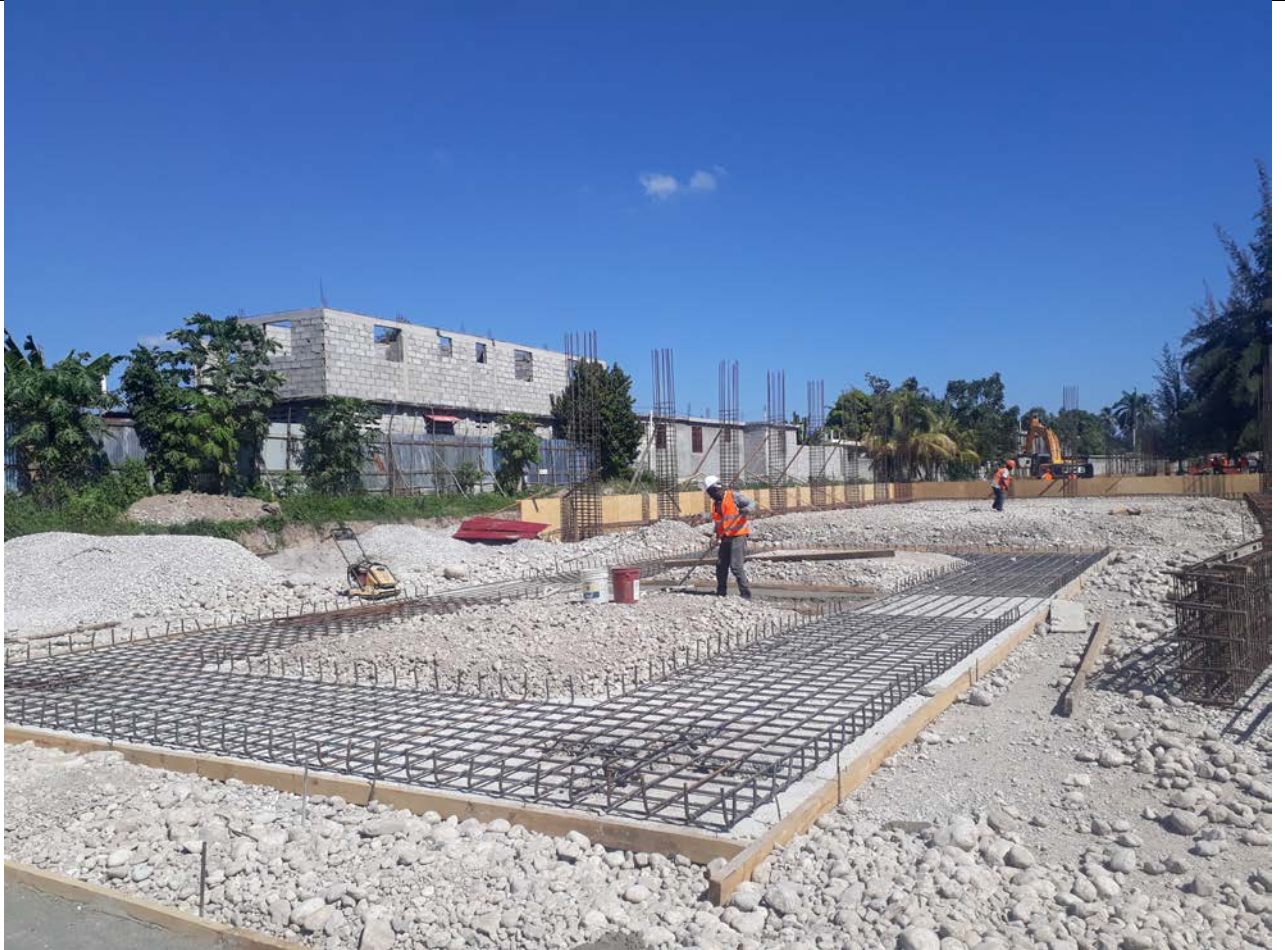
Mise en place beton de propretéet ferrailage