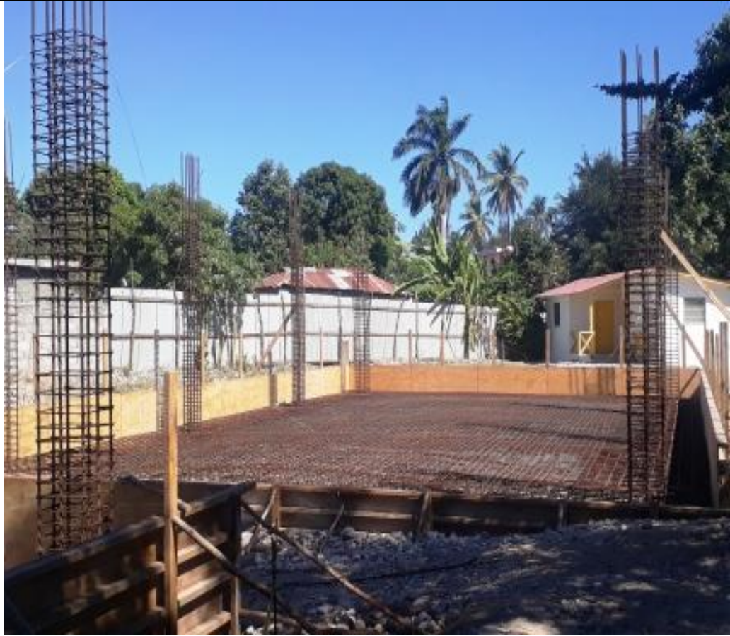
Ferrailage terminé en attente du coulage de béton