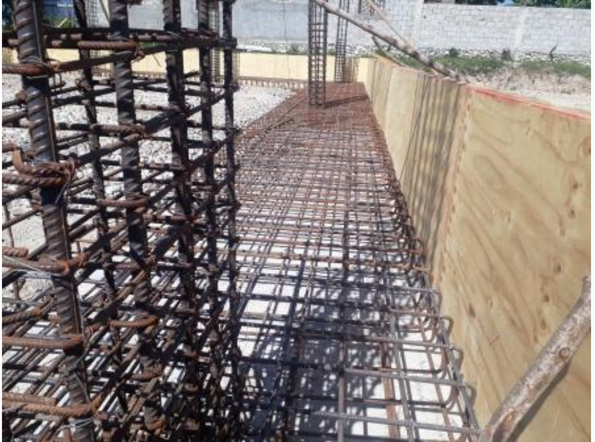
Ferillage en cours dans l'un des bâtiments